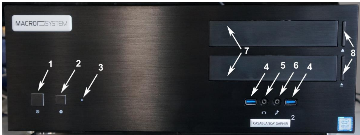
Frontansicht Casablanca 4 SAPHIR 2

Auf der Frontseite der Casablanca 4 SAPHIR 2 - Geräte finden sich folgende Komponenten: