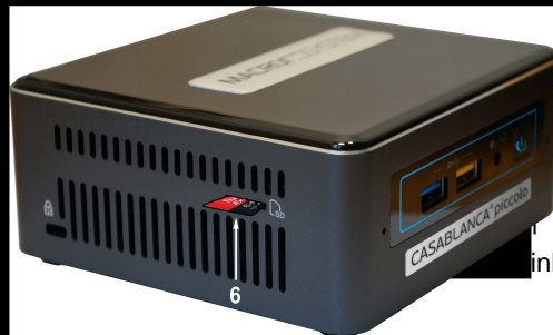
Casablanca 4 piccolo